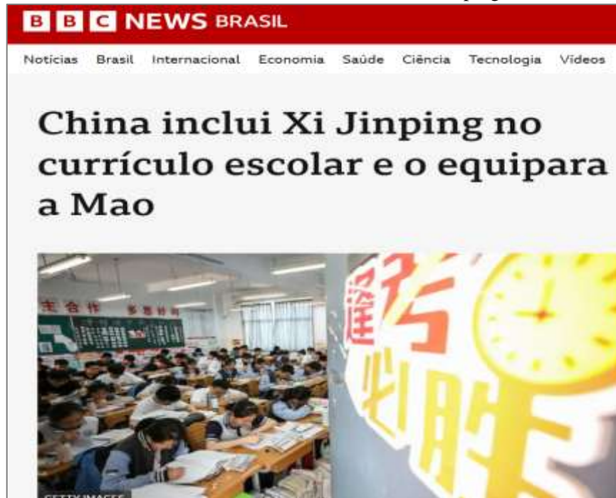
Figura 1 - Matéria da BBC News sobre a inclusão de Xi Jinping no Currículo Chinês