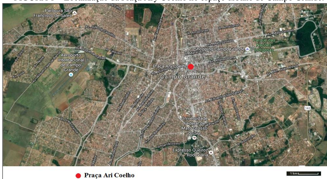
FIGURA 1 – Localização da Praça Ary Coelho no espaço urbano de Campo Grande.

A Praça Ary Coelho está localizada na área central de Campo Grande, entre a Avenida Afonso Pena e ruas 14 de Julho, 13 de Maio e 15 de Novembro, como demonstra a Figura 1.