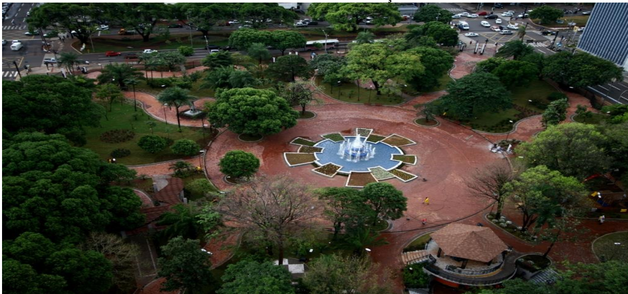
FIGURA 5 – Vista aérea da Praça 2016.