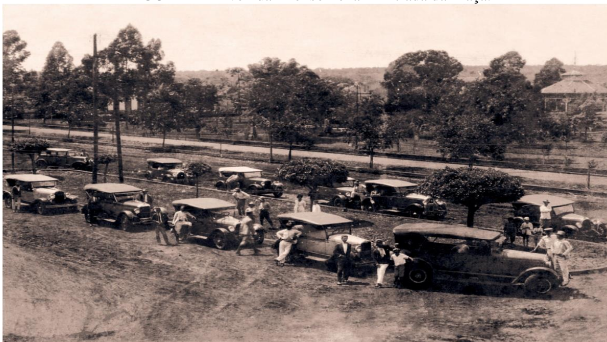
FIGURA 4 – Avenida Afonso Pena – Entrada da Praça.