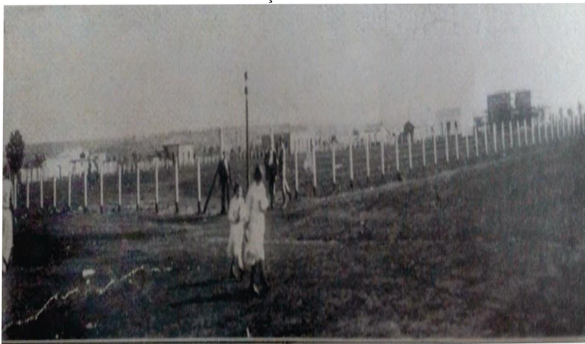
FIGURA 2 - Praça central (atual Ary Coelho) em foto do início do século XX, logo depois da mudança do cemitério.

Em 1909 se deu o novo ordenamento viário da cidade, com a nova proposta urbanística da planta de Nilo Javari Barém, o qual já enxergava o local destinado a praça como um de possível fluxo urbano central da cidade. Até então esse espaço era um cemitério (Figura 2). “Recebeu, inicialmente, o nome de Praça 2 de Novembro em 1913 e, em 1915, passou a ser denominada Praça Municipal ou Jardim. Na década de 20 é cognominada de Praça da Independência e nos anos 30, Praça da Liberdade” (FARACCO; DORSA, 2016, p. 146-147).