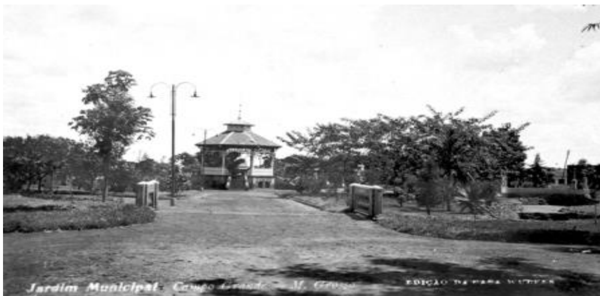
FIGURA 3 - Jardim Municipal no ano de 1920.

https://periodicosonline.uems.br/index.php/GEOF/index