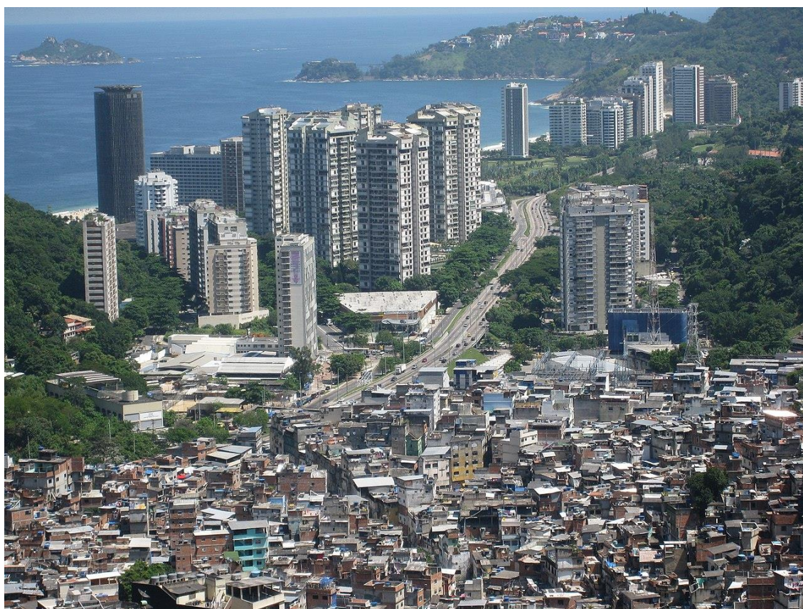
Figura 01 - Favela e prédios de classe alta no mesmo espaço em São Paulo.

Para ilustrar o processo de segregação, a Figura 1 demonstra o processo de segregação na cidade.