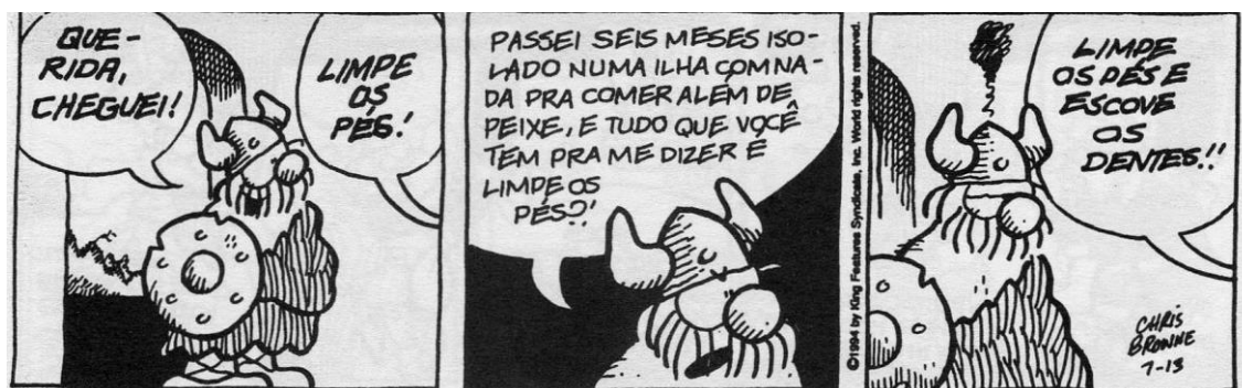
Figura II – Hagar, o Horrível 5 .