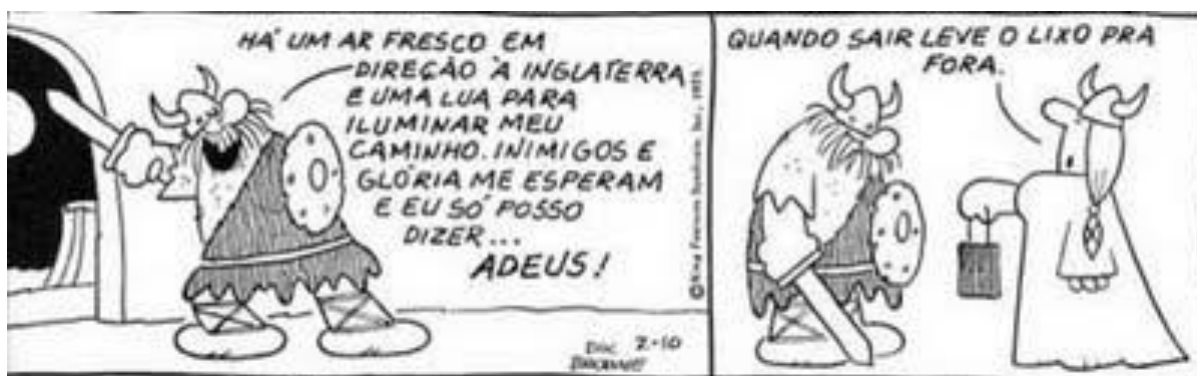
Figura I – Hagar, o Horrível 2 .

A fim de continuarmos nossas análises, passemos para a figura I: