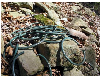
Obr. 2: Fotografie části nalezených náramků.

EDIÇÃO Nº 10 – JUNHO DE 2016. Artigos recebidos até 30/04/2016 artigos aprovados até 30/05/2016