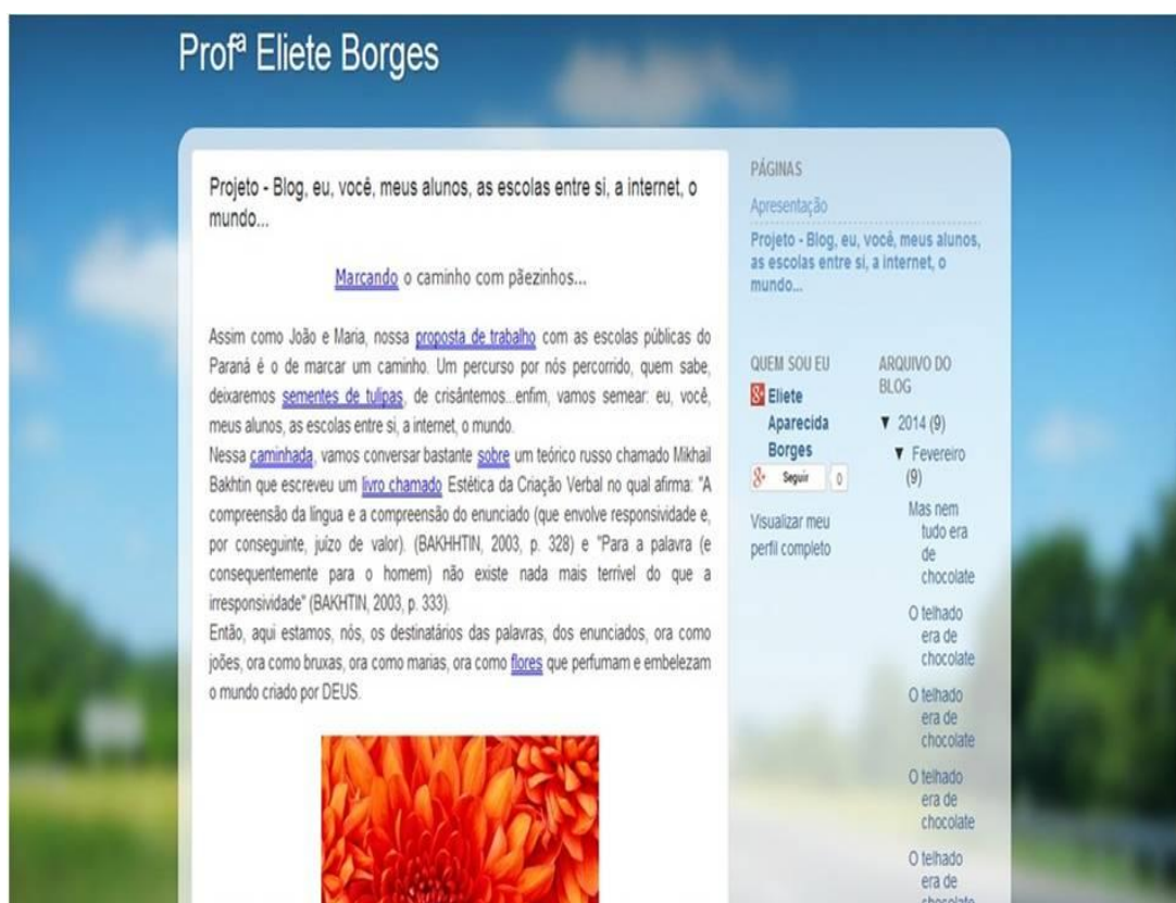
Imagem 06-

Após a criação da conta no Gmail e de seguir todos os passos relacionados acima, cria-se o blog educacional: