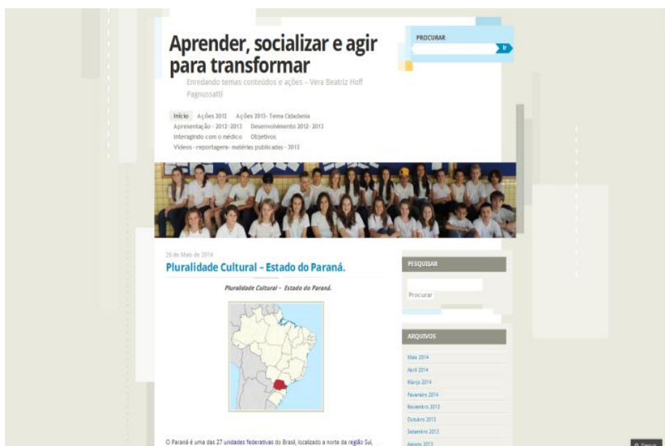
Imagem 04- Disponível em: HTTP://aprendereagir.wordpress.com (Acesso em 26/05/2014).

Imagem 03- Disponível em: HTTP://dialogospoeticosevalorizacaohumana.blogspot.com.br/ (Acesso em 25/05/2014)