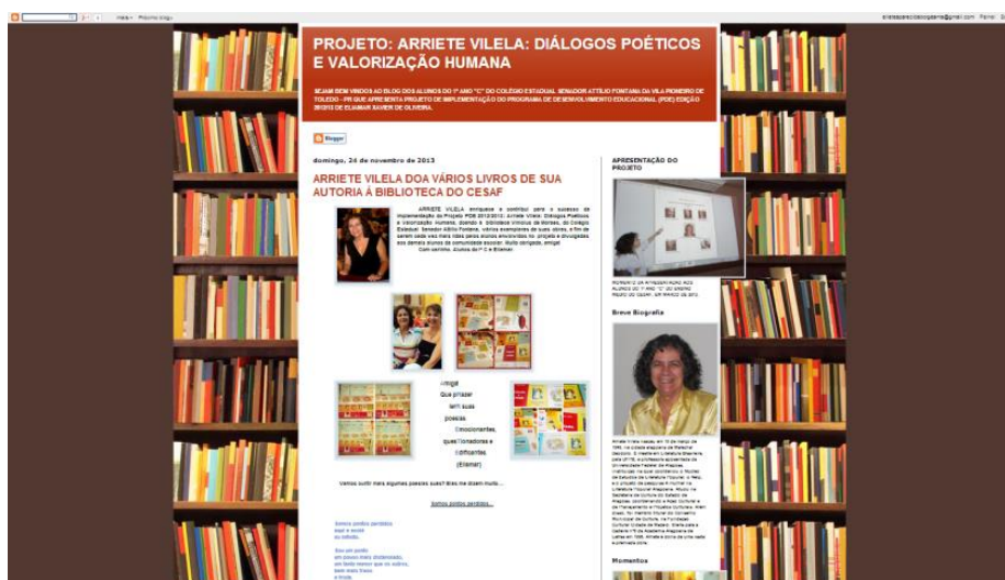
Imagem 03- Disponível em: HTTP://dialogospoeticosevalorizacaohumana.blogspot.com.br/ (Acesso em 25/05/2014)

Imagem 02- Disponível em: HTTP://jornalescolacm.blogspot.com.br/ (Acesso em 25/05/2014)