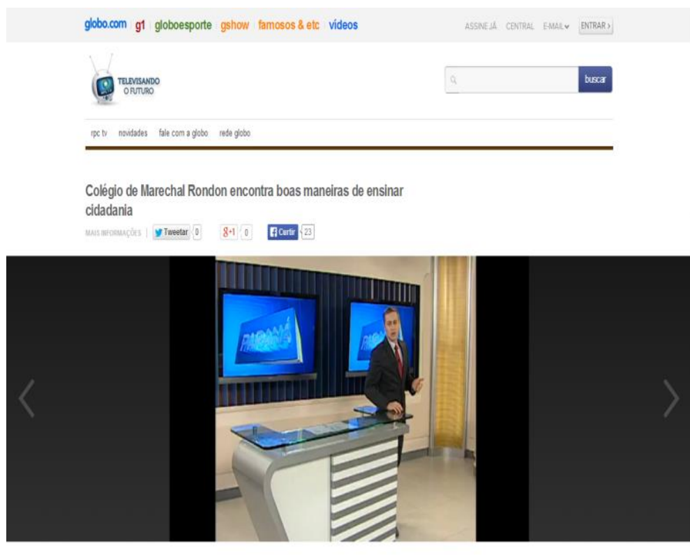
Imagem 05- Disponível

< http://redeglobo.globo.com/PR/rpctv/televisando/vídeos/t/edições/v/colégio-de-marechal-rondon-encontra-boas-maneiras-de-ensinar-cidadania/2640953/ >. Acesso em 25/05/2014.