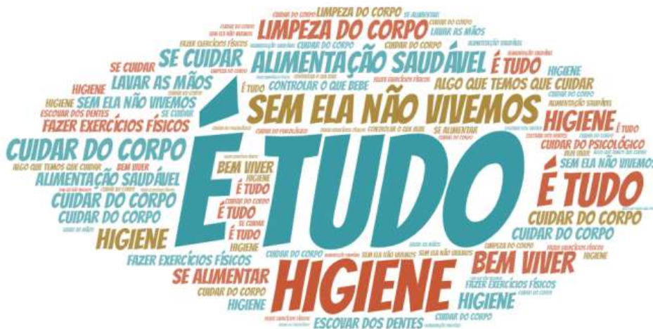
Figura 4. Nuvem de palavras sobre a percepção dos escolares sobre saúde - Escola C.

Já na escola C (Figura 4), os escolares deram maior ênfase para a relação da saúde com a higiene e alimentação saudável, destacando que saúde “é tudo” e que “sem ela não vivemos”.