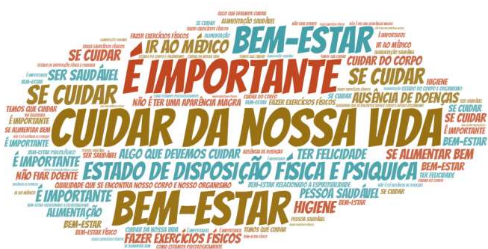
Figura 3. Nuvem de palavras sobre a percepção dos escolares sobre saúde - Escola B.

Nas percepções dos escolares da escola B (Figura 3), também foi destacado o bem-estar, porém, o autocuidado foi enfatizado, como “se cuidar” e “cuidar da nossa vida”.