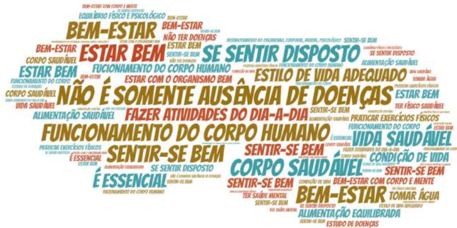
Figura 2. Nuvem de palavras sobre a percepção dos escolares sobre saúde - Escola A.

biológica do modelo de saúde, quando incluíram percepções relacionadas ao “funcionamento do corpo humano”.