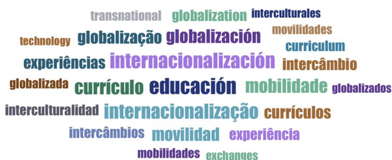
FIGURA 5 – Nuvem de palavras 1