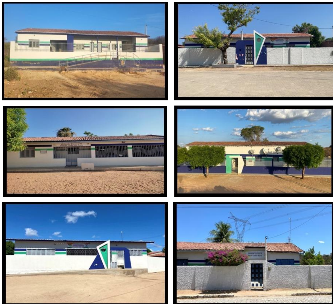
FIGURA 2 – Fachadas das escolas multisseriadas das comunidades rurais de Felipe Guerra - RN