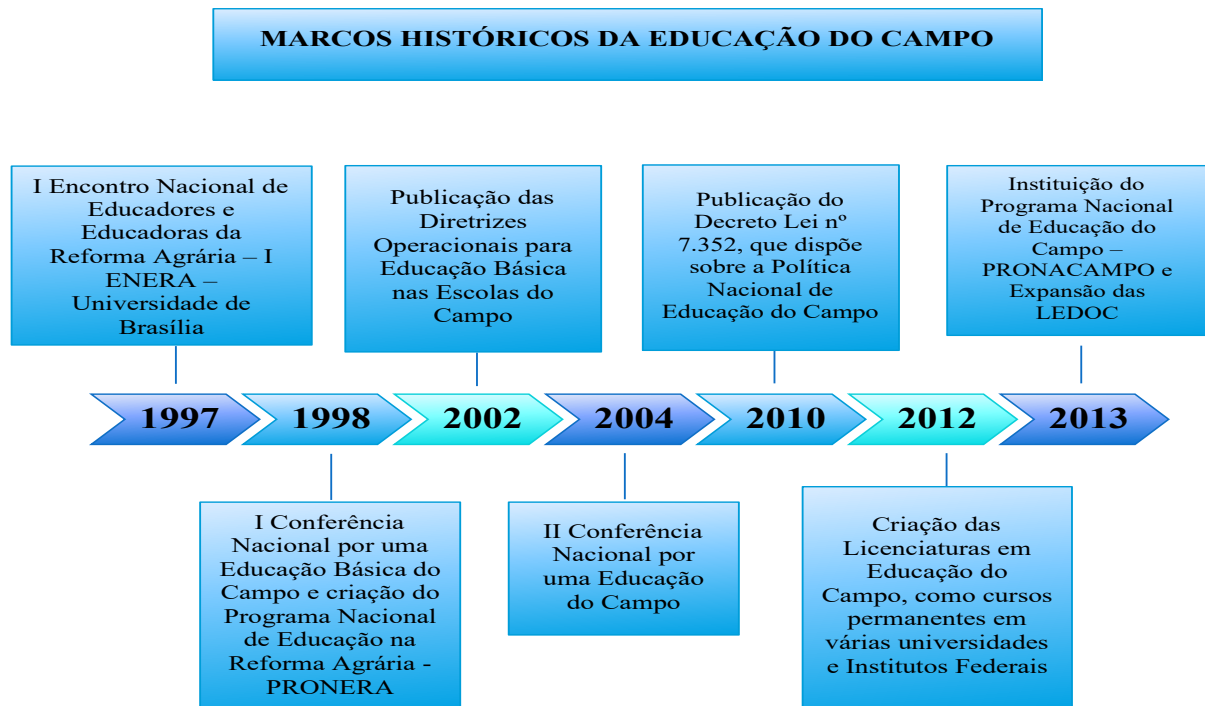
FIGURA 1 – Marcos na história da educação do campo